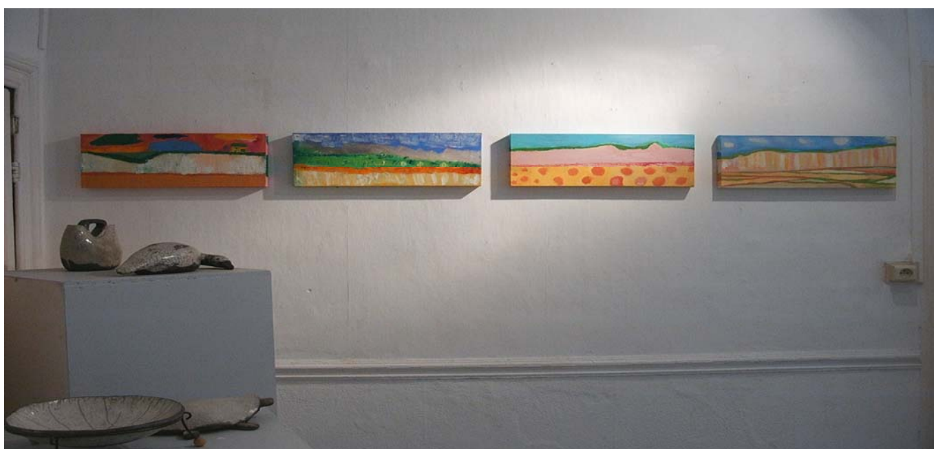
« Les falaises du Bois de Cise » huile sur toile