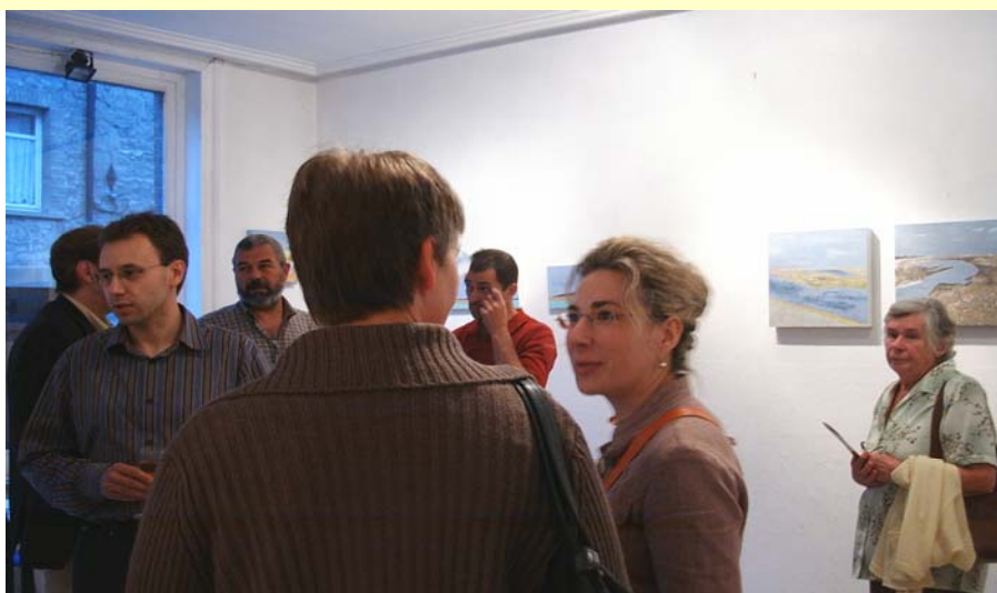
Soirée de vernissage, le verre de l'amitié

Les travailleurs du Bois Roussel, les élèves de l'académie de Ciney, les stagiaires de l'Atelier du Vent d'Est , tous réunis, pour offrir aux visiteurs une exposition très atmosphérique. Il est vrai que toutes les salles d'exposition embaumaient