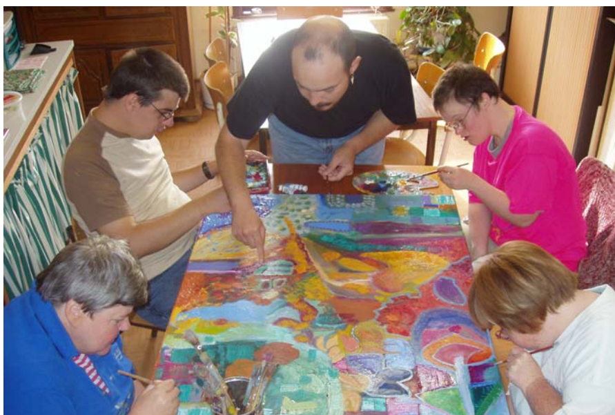
La dernière équipe au travail

Tous les artistes du Bois Roussel ont participé à la création de « Symbiosis », une toile de 80 x 100 cm, entièrement peinte à l'huile qui sera l'œuvre mise aux enchères, cette année, lors de notre souper de novembre. Vous avez, en avant première, la chance de découvrir le travail en cours et l'œuvre terminée, une œuvre qui s'est enrichie de semaine en semaine, par la touche personnelle de chaque travailleur. La thématique était « des mots en couleurs », comme une conversation, les couleurs étaient leurs mots, il en résulte une œuvre très construite, toute en couleur. Leurs